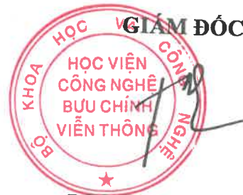
PGS.TS Đặng Hoài Bắc